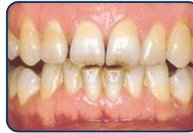
Voor het bleken

durig of herhaald bleken op het tandweefsel is nog niet helemaal bekend. Bleek uw tanden daarom onder toezicht en controle van uw tandarts of mondhygiënist.