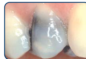
Grijze of zwarte vulling