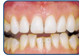
Na het bleken (en repareren)