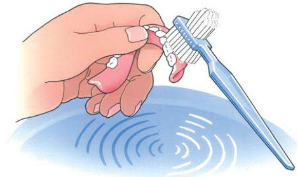
Reinig uw kunstgebit na iedere maaltijd

Uw kunstgebit is nu nog nieuw en mooi. Dat wilt u natuurlijk graag zo houden. Daarom moet u, net als bij eigen tanden en kiezen, uw kunstgebit verzorgen. Als u het niet regelmatig schoonmaakt, blijven er voedselresten achter. Zowel op uw kunstgebit als eronder. Als u die niet verwijdert, kan uw tandvlees op den duur gaan ontsteken. Reinig uw gebit daarom zorgvuldig na iedere maaltijd. Gebruik een speciale protheseborstel, bijvoorbeeld van Lactona of Oral-B, en water om etenresten goed te verwijderen. Gebruik géén tandpasta. Die kan te veel schuren. Een schoon kunstgebit voelt altijd glad aan. Laat uw gladde gebit tijdens het reinigen niet uit uw handen glippen. Het zal kapot gaan. Vul voor de zekerheid eerst de wasbak met water en reinig uw gebit daarboven.