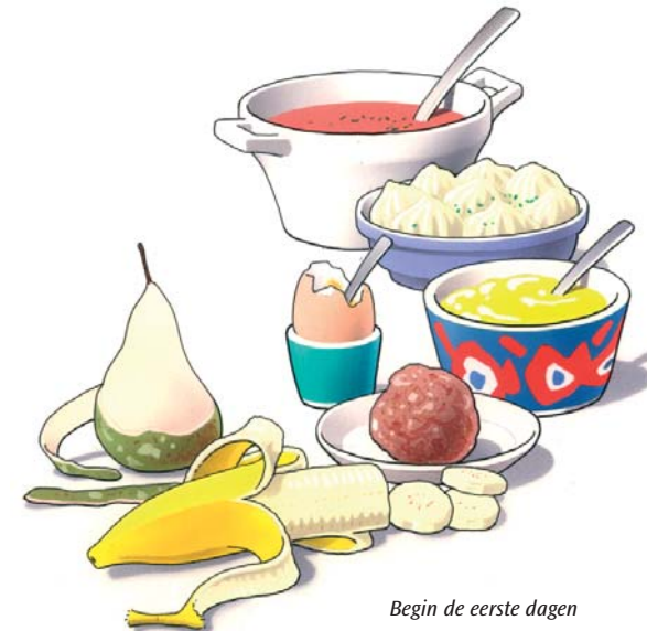
Begin de eerste dagen met zacht voedsel

Eten met uw nieuwe kunstgebit is wat onwennig. Zeker in het begin zult u voorzichtig aan doen. U ervaart zelf het beste wat wel en niet kan. Neem de eerste dagen zacht voedsel, zoals puree, gehakt en zacht fruit. Probeer enkele dagen daarna een stukje vis en een aardappel. Weer later kunt u voedsel eten zoals vlees of een appel. Stukken afbijten kunt u met een kunstgebit beter niet doen. Snijd uw voedsel daarom in stukjes en kauw rustig en gelijkmatig met uw nieuwe kunstkiezen. Neem daarbij aan beide zijden een stukje voedsel in de mond. Neem er iets meer tijd voor dan dat u gewend was.