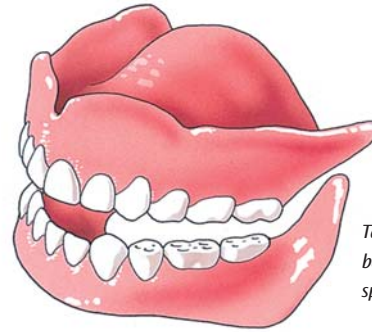
Tanden en kiezen zijn belangrijk voor het kauwen, spreken en het uiterlijk

Als u in de spiegel kijkt, moet u waarschijnlijk erg wennen. Uw mond is nu een maal een belangrijke blikvanger en die is veranderd. Neem een paar dagen de tijd om te wennen en beoordeel pas dan hoe u er met uw nieuwe tanden en kiezen uitziet.