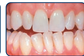
Resultaat na tien dagen bleken met de thuisbleekmethode onder begeleiding van de tandarts