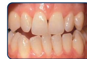
Voor het bleken

De lengte van een bleekbehandeling hangt af van de bleekmethode. Bij de thuisbleekmethode duurt het meestal twee weken voordat u een gewenst resultaat bereikt.